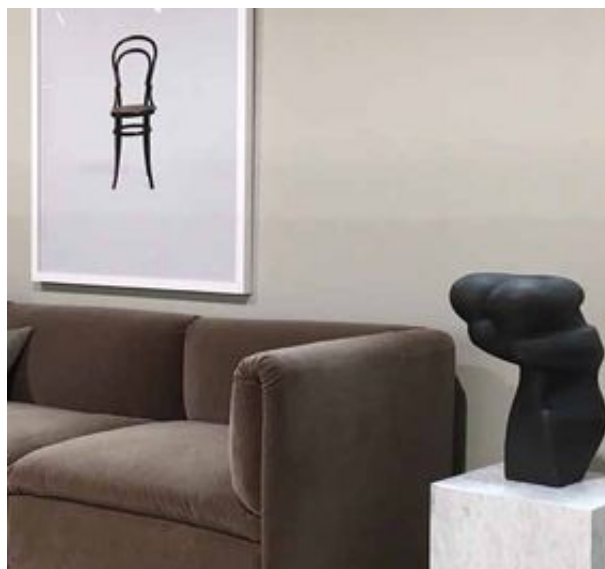
Detaljbild från Trendutställningen, piedestal från Menu och soffan Retreat från Fogia.