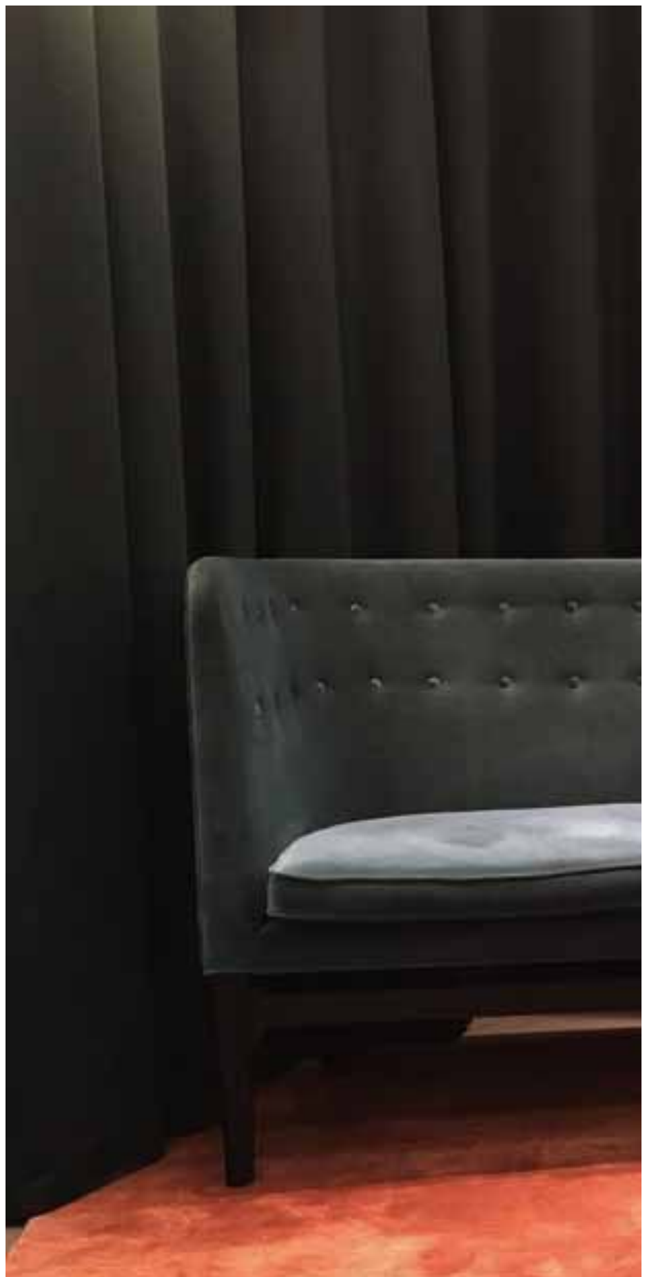
Klassiska soffan Mayor ritad år 1939 av Arne Jacobsen & Flemming Lassen. I &Traditions utställning var den uppdaterad i grönt sammetsstyg.