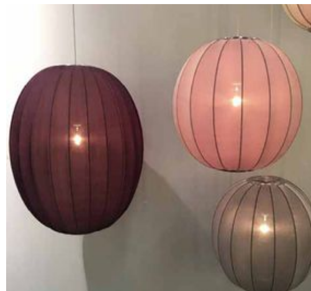
Knit-Wit lampor, vackra stickade lampor i design av Iskos-Berlin för Made by Hand.