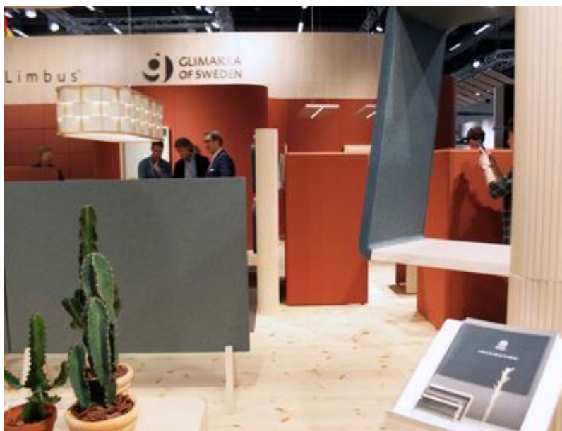
Hemligt och skandinaviskt med mycket ljusst trä hos Glimakra.

uppfattar bakgrundsljud utan att tappa koncentrationen.