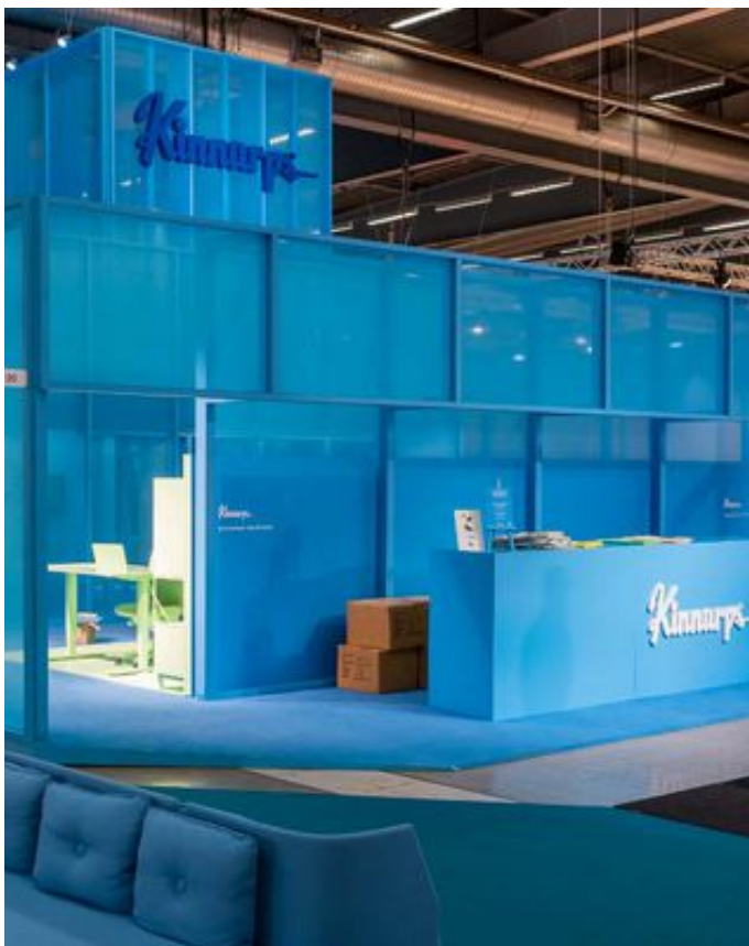
Kinnarps monter fick pris i Editors' Choice 2017.