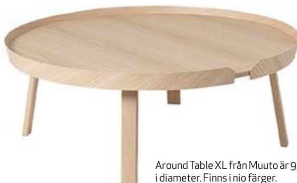
Around Table XL från Muuto är 95 cm i diameter. Finns i nio färger.

Stolen Connecting Seat från Götessons är som en smal puff på hjul med hög rygg som går att koppla ihop till