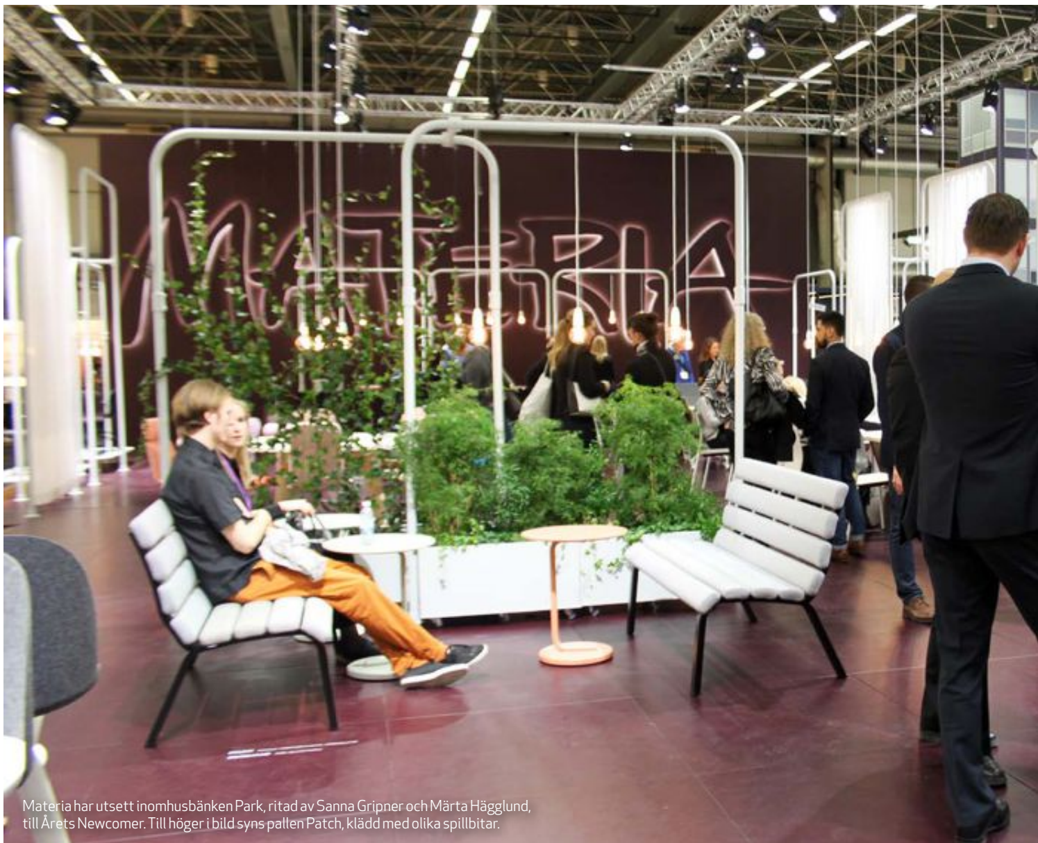
Materia har utsett inomhusbänken Park, ritad av Sanna Gripner och Märta Hägg Lund, till Årets Newcomer. Till höger i bild syns pallen Patch, klädd med olika spillbitar.