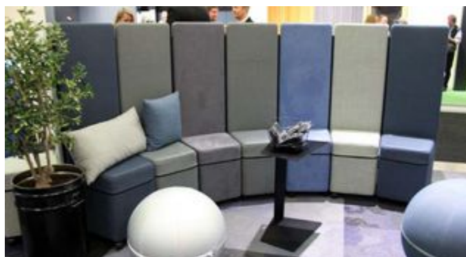
Connecting Seat från Götessons är som en smal puff på hjul med hög rygg som går att koppla ihop till en soffa.

"Du måste ta ett komplext budskap och göra det riktigt enkelt och förståeligt. Kinnarps monter gör det på ett djärvt, tydligt och intelligent sätt."